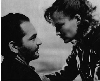
1951 LA STRADA FINISCE SUL FIUME de Luigi Capuano avec Constance Dowling