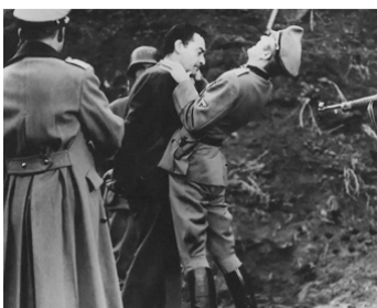
1962 LA FURIE DES S.S. (Dieci italiani per un tedesco) de Filippo Walter Ratti