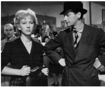
1946 UN AMÉRICAIN EN VACANCES (Un Americano in vacanza) de Luigi Zampa avec Valentina Cortese