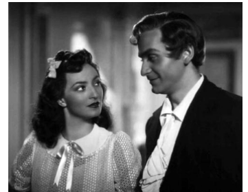
1942 LA CONTESSA CASTIGLIONE de Flavio Calzavara avec Doris Duranti