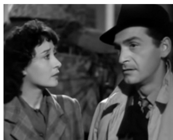
1944 DEUX LETTRES ANONYMES (Due lettere anonime) de M. Camerini avec Clara Calamai