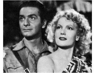
1941 ALERTE AUX BLANCS (Senza cielo) d'Alfredo Guarini avec Isa Miranda