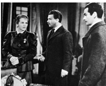
1943 TRISTES AMOURS (Tristi amori) de Carmine Gallone avec Luisa Ferida, Gino Cervi