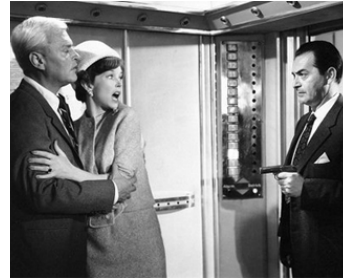
1960 LE DIABOLIQUE DOCTEUR MABUSE de F. Lang avec Peter Van Eyck, Dawn Addams