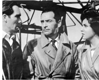
1951 ATTENTION BANDITS ! (Achtung banditi!) de Carlo Lizzani avec V. Duse, G. Lollobrigida