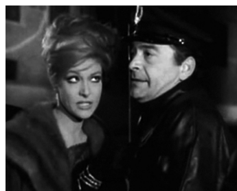
1962 COLPO GOBBO ALL'ITALIANA de Lucio Fulci avec Helene Chanel