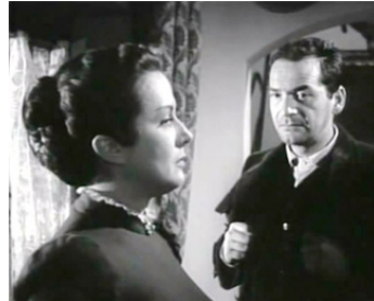
1954 L'AMOUR VIENDRA (Appassionamento) de Giacomo Gentilomo avec Myriam Bru