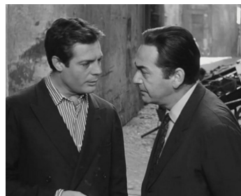
1961 L'ASSASSIN (L'assassino) d'Elio Petri avec Marcello Mastroianni