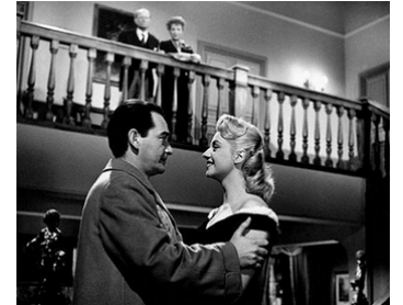
1955 BONSOIR MAÎTRE (Buananotte... avvocato!) de Giorgio Bianchi avec Mara Berni