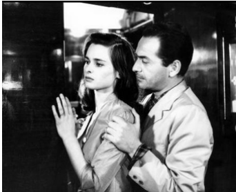
1953 LA DAME SANS CAMÉLIA (La signora senza camelia) de M. Antonioni avec Lucia Bosè