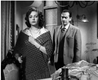
1956 L'INTRUSE (L'intrusa) de Raffaello Matarazzo avec Lea Padovani