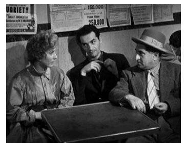
1945 LA NUIT PORTE CONSEIL (Roma città libera) de M. Pagliero avec Valentina Cortese