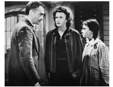
1949 AU-DELÀ DES GRILLES de René Clément avec Isa Miranda, Vera Talchi