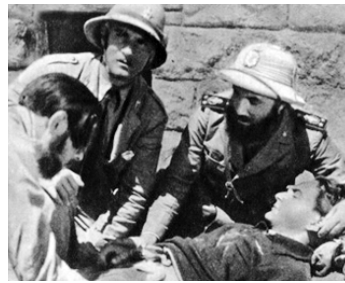
1938 LUCIANO SERRA, PILOTE (Luciano Serra, pilota) de G. Alessandrini avec Amedeo Nazzari