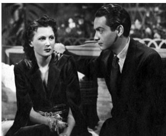
1942 LÈVRES CLOSES (Labbra serrata) de Mario Mattoli avec Annette Bach