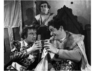
1951 LE CAPITAINE VÉNITIEN (Il capitano di Venezia) de Gianni Puccini