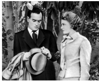
1934 LA DAME DE TOUT LE MONDE (La Signora di tutti) de Max Ophüls avec Isa Miranda