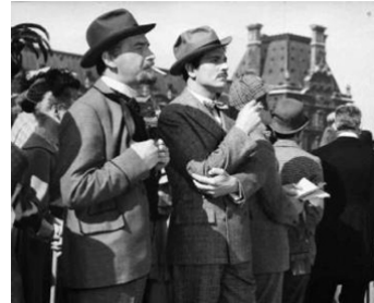
1954 LA MAISON DU SOUVENIR (Casa Ricordi) de Carmine Gallone avec Gabrielle Ferzetti