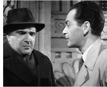
1951 ACTE D'ACCUSATION (Atto d'accusa) de Giacomo Gentilomo avec Gaetano Verna