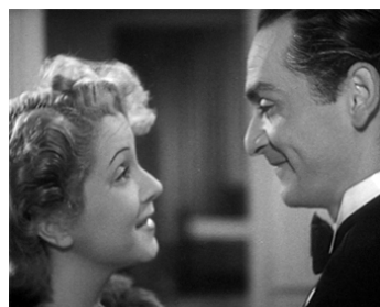
1945 UNE JEUNE FILLE SAGE (Biraghin) de Carmine Gallone avec Lilia Silvi