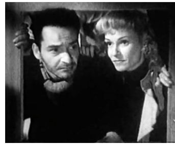
1947 CHASSE TRAGIQUE (Caccia tragica) de Giuseppe De Santis avec Vivi Gioi