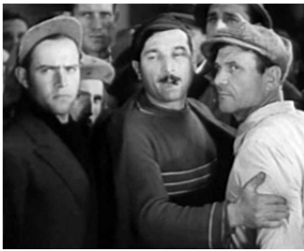
1934 LA VIEILLE GARDE (Vecchia guardia) d'Alessandro Blasetti avec Cesare Zopetti