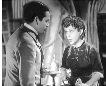
1940 GIÙ IL SIPARIO de Raffaello Matarazzo avec Lilia Silvi