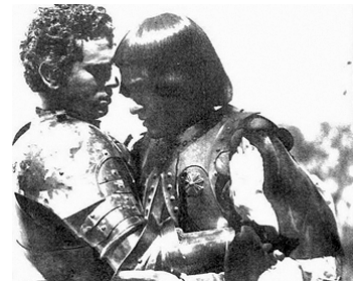
1938 ETTORE FIERAMOSCA (Ettore Fieramosca) de Goffredo Alessandrini avec Gino Cervi