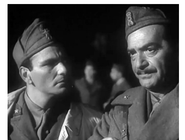
1964 MARCHER OU MOURIR (Italiani brava gente) de Giuseppe De Santis avec Peter Falk