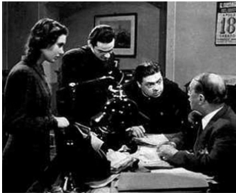
1942 AVANTI C'È POSTO de Mario Bonnard avec Adriana Benetti, Aldo Fabrizi