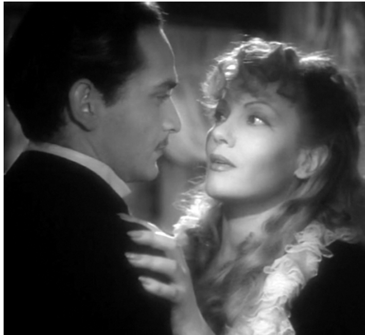
1943 MALOMBRA (Malombra) de Mario Soldati avec Isa Miranda