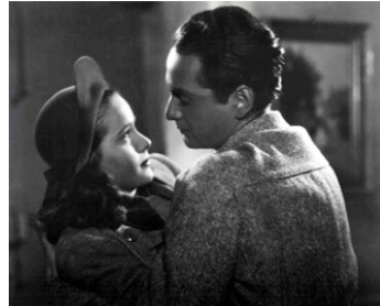
1942 CHAÎNES INVISIBLES (Catene invisibili) de Mario Mattoli avec Alida Valli