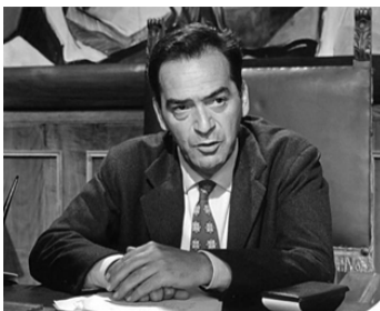
1961 DON CAMILLO... MONSEIGNEUR (Don Camillo monsignore) de Carmine Gallone