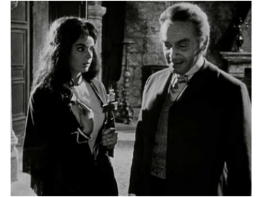
1960 LE MASQUE DU DÉMON (La maschera del demonio) de Mario Bava avec Barbara Steele