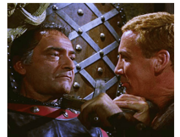
1961 LA RUÉE DES VIKINGS (Gli invasori) de Mario Bava avec Cameron Mitchell